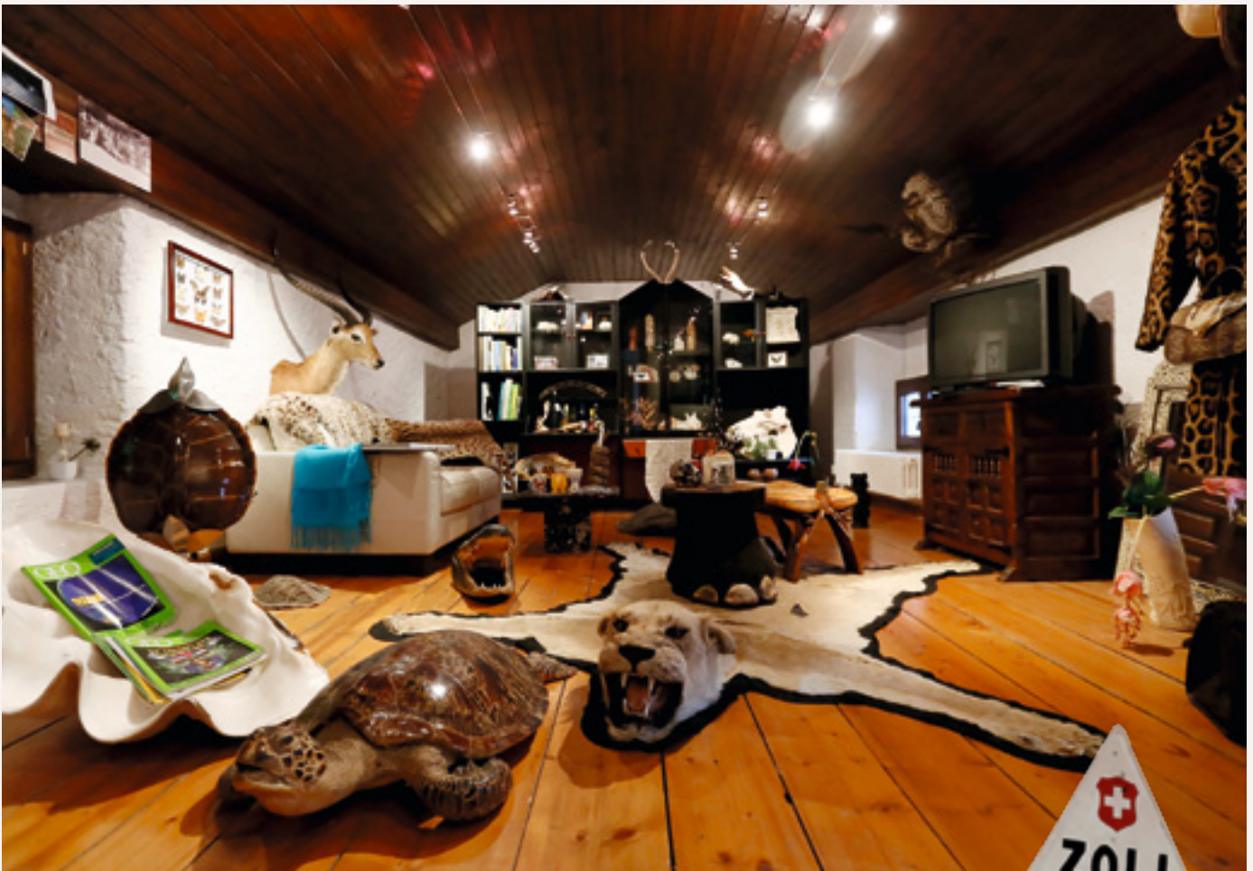
Einst Schmugglergut, heute Ausstellungsstücke: Im Zollmuseum von Gandria.